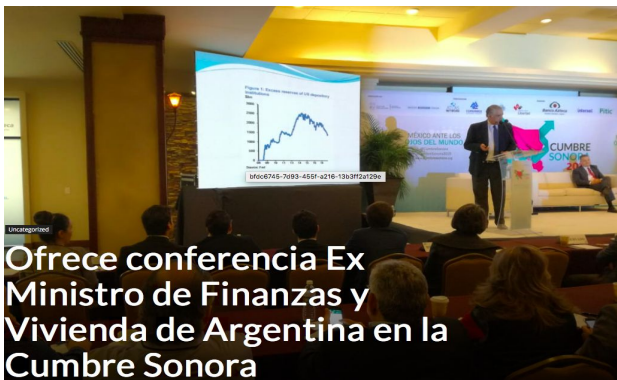
Ofrece conferencia Ex Ministro de Finanzas y Vivienda de Argentina en la Cumbre Sonora

Una de las conferencias magistrales que más alta expectativa generó en la Cumbre Sonora 2019, fue la de Ricardo López Murphy llamada, "México y el mundo, la perspectiva desde el Cono Sur".