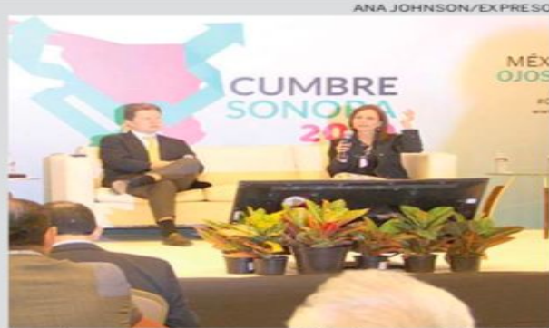
Sary Levy, directora general de la Academia Nacional de Ciencias Económicas de la Universidad Central de Venezuela.

Propuso que las migraciones en el mundo moderno en vez de verse como una pérdida o una fuga en el circuito económico se deben de ver como una oportunidad y esperanza de cambio para la creación de una red de relaciones internacionales que promuevan